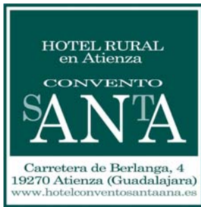
Hotel Convento Santa Ana